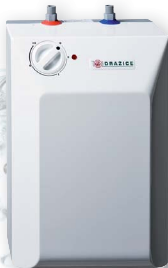
BTO 5 IN