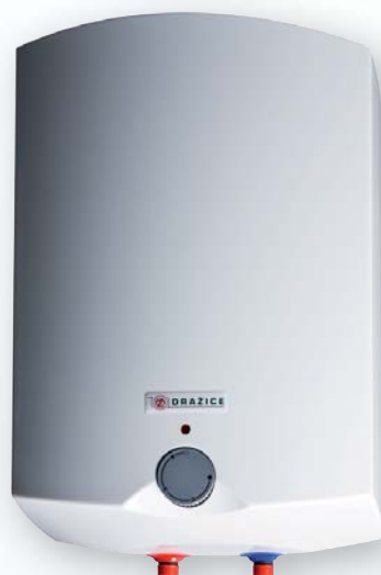
BTO 10 UP