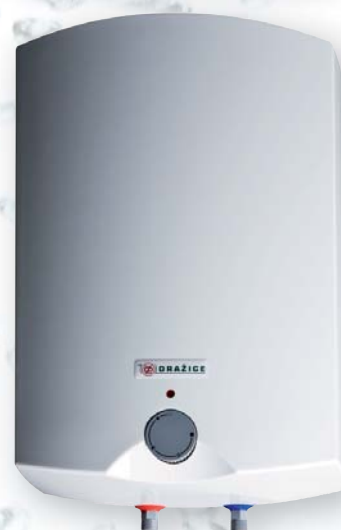
BTO 10 UP