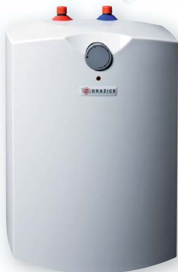
BTO 5 IN