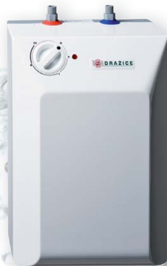
BTO 5 IN