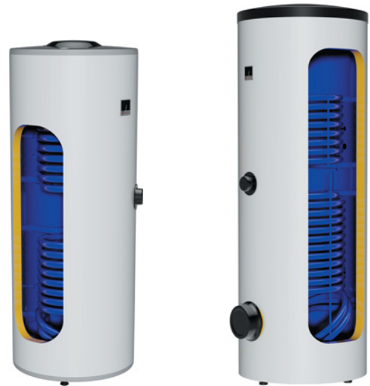
OKC 200, 250 NTRR/SOL

Pozn: ** K ohřivači je přiložen pojistný ventil 6 bar.