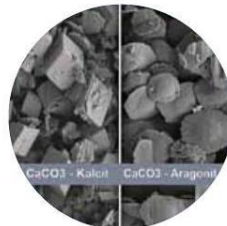
Změna struktury uhlíkatu vápenatého ( \text{CaCO}_3 ) z tvrdého kalcitu na jemný aragonit