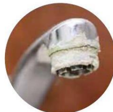
kuchyňské a koupelňové baterie