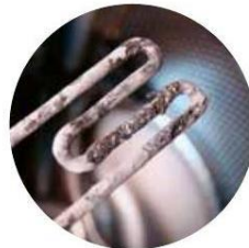
pračky a myčky nádobí