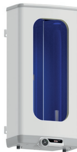
OKHE ONE/E 50–100

pomocí univerzálního závěsu – šířka drážky na šroub M6 na šroub M8