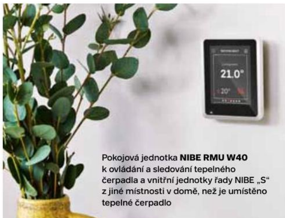
Pokojeová jednotka NIBE RMU W40 k ovládání a sledování tepelného čerpadla a vnitřní jednotky řady NIBE „S“ z jiné místnosti v domě, než je umístěno tepelné čerpadlo

Součástí systému je také aplikace myUplink, která umožňuje sledování a ovládání tepelného čerpadla pohodlně z vašeho chytrého telefonu nebo tabletu odkudkoli. K aplikaci je možné připojit veškeré chytré příslušenství, a mít tak detailní kontrolu nad celou budovou. Pokud bude systém ovlivněn provozní poruchou, obdržíte upozornění prostřednictvím nabízených zpráv a e-mailu, což vám umožní rychle reagovat.