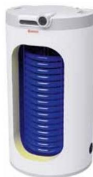
Stacionární nepřímotopný zásobník OKC 125.1 NTR/HV v nadstandardní energetické třídě A

Kromě pořízení nového bojleru byste neměli zapomenout ani na pravidelnou kontrolu vybavení vaší domácnosti a drobné změny každodenních návyků. Lukáš Formánek radí: „Víte například, že netěsnícím kohoutkem proteče více než