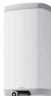
Elektrický závěsný ohřivač vody OKHE SMART 3. generace (DZD)

160 litrů vody za měsíc, ale pokud jej dáte opravit a doplníte termostatickou baterii, uspoříte až 50 % vody potřebné k mytí rukou nebo sprchování? Další úspory s sebou přináší použití úsporné myčky nádobí nebo zalévání pomocí dešťové vody. Právě na její využití nyní můžete navíc získat příspěvek v rámci programu Nová zelená úsporám.“