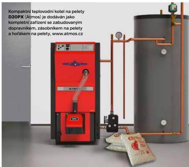
Kompaktní teplovodní kotel na pelety D20PX (Atmos) je dodáván jako kompletní zařízení se zabudovaným dopravníkem, zásobníkem na pelety a hořákem na pelety, www.atmos.cz