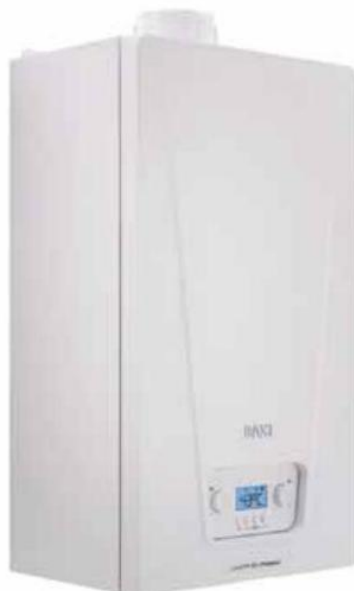
Základní modelová řada kondenzačního kotle Luna (BAXI). V nabídce je provedení kombi (24 kW nebo 28 kW) a model pro externí ohřev TUV v zásobníku o výkonu 24 kW, www.baxi.cz

při menších provozních nákladech a s mnohem menším ekologickým zatížením pro okolí, než tomu bylo v minulosti. Díky zplyňování je palivo velmi účinně využito, automaticky řízené systémy mohou dosáhnout účinnosti dokonce až 90 %. Kromě toho znamená pořízení automatického kotle také vysoký uživatelský komfort.