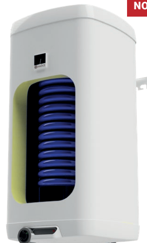
OKHE 125-160 NTR/DV