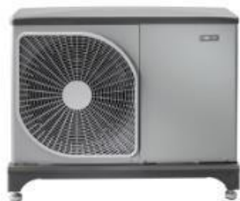
Venkovní tepelné čerpadlo systému vzduch-voda NIBE F2040-6

http://www.tzb-info.cz/t.py?t=55&i=122330