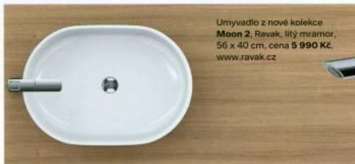
Umyvadlo z nové kolekce Moon 2 , Ravak, litý mramor, 56 x 40 cm, cena 5 990 Kč , www.ravak.cz

prostoru. Změna nastala také v materiálech. Vedle keramiky se nyní na výrobu umyvadel používá také umělý kámen, smaltovaná ocel nebo různé kompozitní hmoty. Možnostem nových materiálů se přizpůsobila i keramická hmota, z níž se dnes díky novým technologiím vyrábějí i umyvadla s velmi tenkými obvodovými stěnami, které jsou přes optickou křehkost pevné a odolné.