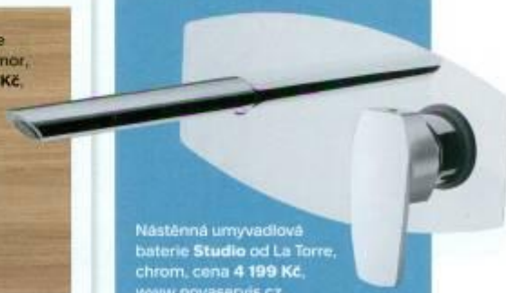
Nástěnná umyvadlová baterie Studio od La Torre, chrom, cena 4 199 Kč , www.novaservis.cz