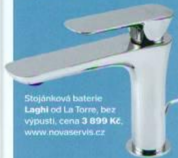
Stojánková baterie Laghi od La Torre, bez vypusti, cena 3 899 Kč , www.novaservis.cz

Nezbytnou součástí umyvadel jsou baterie, které se podle umístění dělí na stojánkové, jež jsou upevněné v otvoru umyvadla nebo zapuštěné do umyvadlové desky, a nástěnné v moderním podomítkovém provedení. Podle ovládání se dělí na kohoutkové, pákové nebo joystickové. Klasické kohoutky jsou k dispozici v retro podobě i v moderním provedení například ve tvaru kříže.