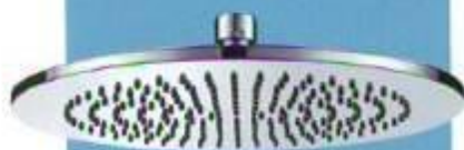
Hlavová sprcha Optima, mosaz, Ø 20 cm, cena 2 490 Kč, www.siko.cz