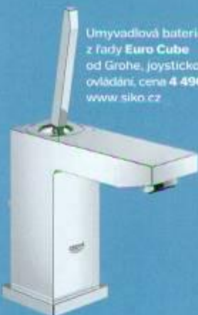
Umyvadlová baterie z řady Euro Cube od Grohe, joystickové ovládání, cena 4 490 Kč , www.siko.cz