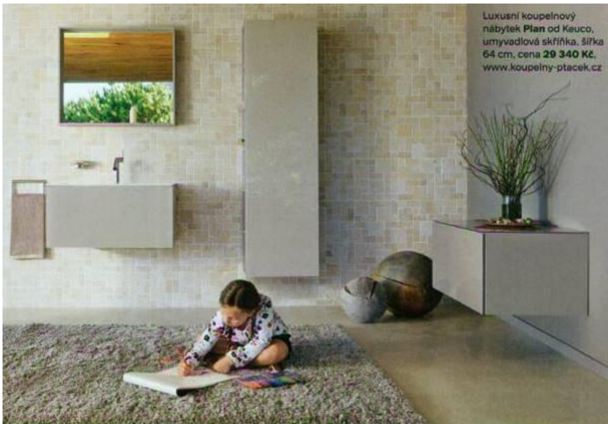
Luxusní koupelnový nábytek Plan od Keuco, umyvadlová skříňka, šířka 64 cm, cena 29 340 Kč , www.koupeiny-ptacek.cz