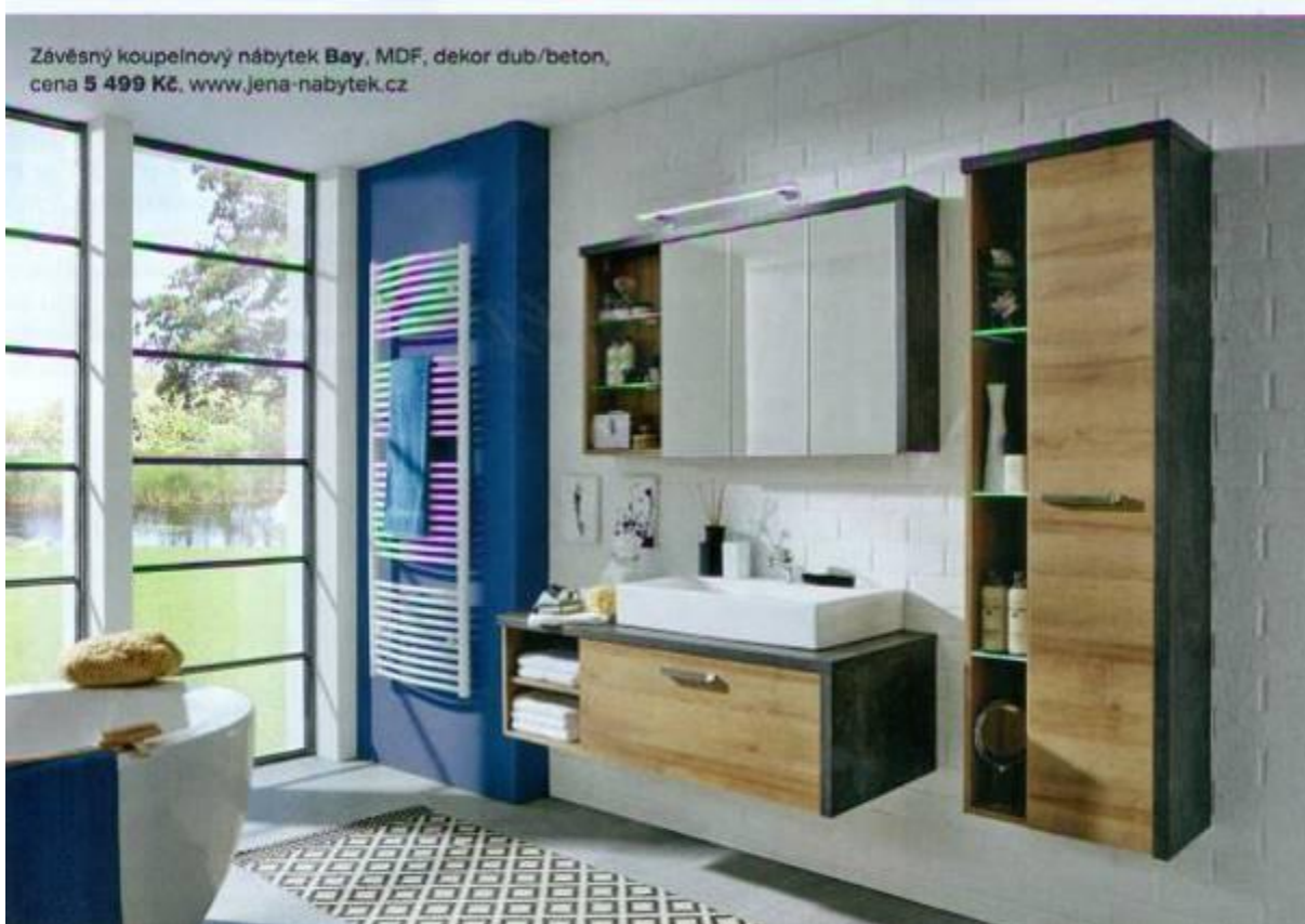
Závěsný koupelnový nábytek Bay , MDF, dekor dub/beton, cena 5 499 Kč , www.jena-nabytek.cz