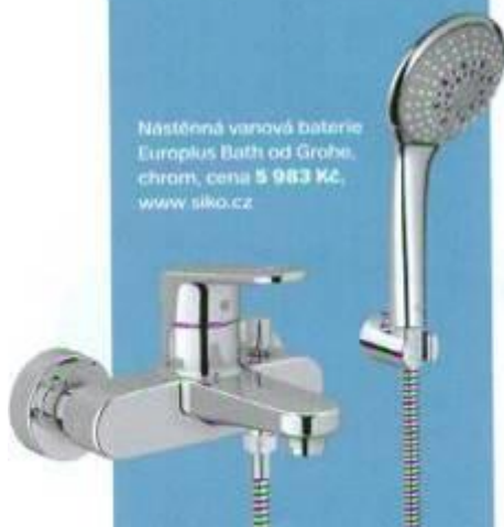
Nástěnná vanová baterie Europlus Bath od Grohe, chrom, cena 5 983 Kč, www.siko.cz