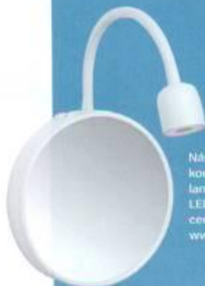
Nástěnná koupelňová lampa Biávik , LED, krytí IP 44, cena 299 Kč , www.ikea.cz

Svítlidla ve vlhkém prostředí koupelny musí mít bezpečnostní krytí, které se označuje písmeny IP a číslicí, jež vyjadřuje stupeň ochrany. Nejvyšší krytí IP 44 je vhodné k umístění do rizikových zón okolo vany nebo ve sprchovém koutě. Kromě centrálního světla by v koupelně nemělo chybět osvětlení u zrcadla s dostatečnou intenzitou a příjemnou barvou světla.