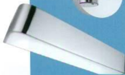
Nástěnné svítidlo Plano , Philips, matný chrom/plast, krytí IP 44, svíslá | vodorovná montáž, cena 2 960 Kč , www.rent.cz

Zrcadlo ze série Dea , Ideal Standard, integrované LED osvětlení, několik rozměrů, cena k doptání, www.idealstandard.com