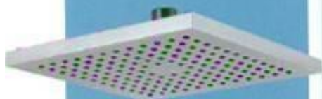
Hlavová sprcha samočisticí RUP 220 od Novaservis, chrom, 20 x 20 cm, cena 999 Kč, www.novaservis.cz

Sprchové kouty mohou být vybavené jednou nebo dvěma sprchami. K relaxačním účelům se používá pevná hlavová sprcha, která může být součástí sprchové tyče nebo být samostatně upevněná do podhledu. K rychlému osprchování je vhodnější ruční sprcha s hlavici s přepínáním na různé režimy proudu vody. Usazování vodního kamene zabraňují pružné silikonové trysky.