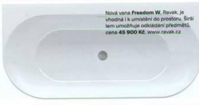
Nová vana Freedom W, Ravak, je vhodná i k umístění do prostoru. Širší lem umožňuje odkládání předmětů, cena 45 900 Kč, www.ravak.cz

a hustý dešťový proud se ale lze odvádět relaxaci i ve sprchovém koutě. Vodní masáž tu poskytnou sprchové panely s tryskami, které se dají nastavit podle individuálních potřeb i přizpůsobit rozdílně vysokým osobám. Atmosféru ve vaně i v koutě mohou podtrhnout barevná světla. Vedle klasických koutů se nyní prosazují bezbariérové typy zvané walk in, které se neuzavírají a jsou ve stejné rovině s podlahou.