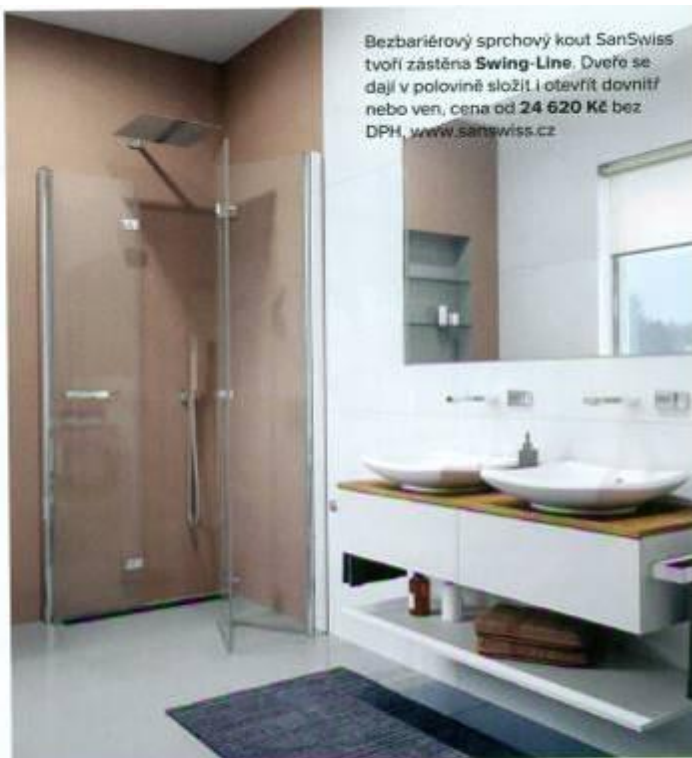
Bezbariérový sprchový kout SanSwiss tvoří zástěna Swing-Line. Dveře se dají v polovině složit i otevřít dovnitř nebo ven, cena od 24 620 Kč bez DPH, www.sanswiss.cz