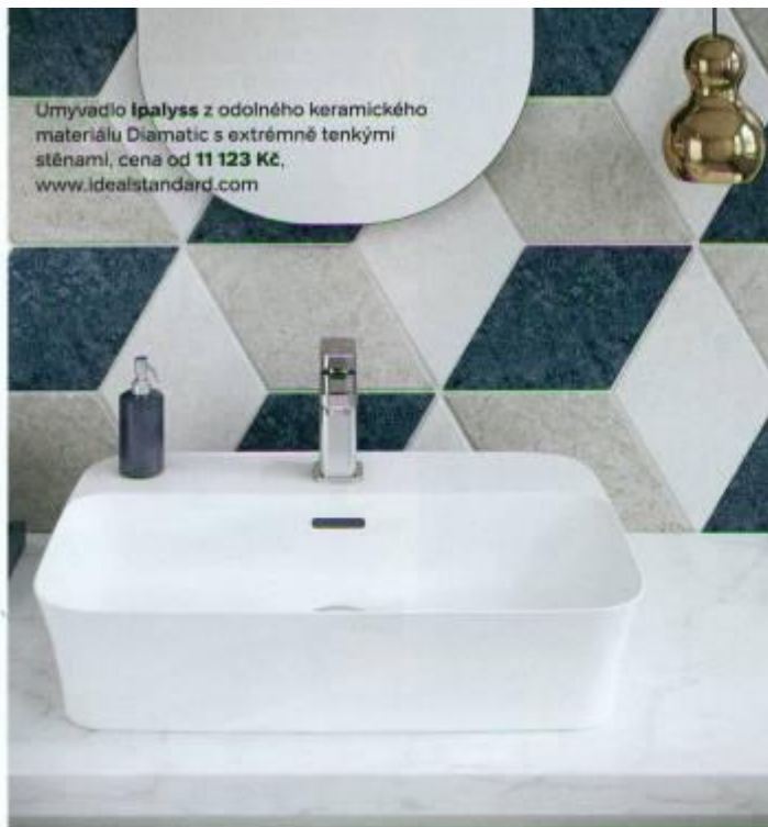
Umyvadlo Ipalyss z odolného keramického materiálu Diamatic s extrémně tenkými stěnami, cena od 11 123 Kč , www.idealstandard.com