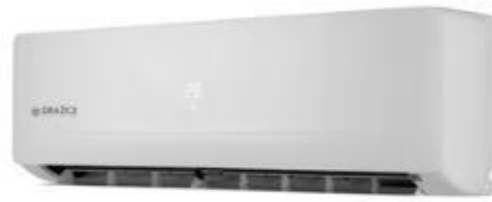
Vnější a vnitřní jednotka dražické klimatizace AIR