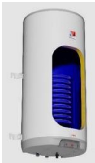
Hybridní ohřívač vody LX ACDC/M+K 200 ABC

tomuto systému, který DZ Dražice vyvinula společně s firmou Logitex, tak není nutné posílat přebytky energie do sítě nebo je ukládat do vlastní baterie.