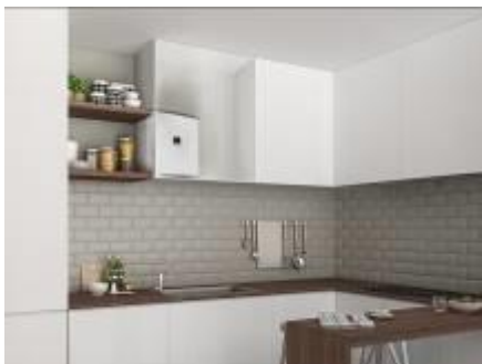
Elektrický plochý ohřivač vody OKHE ONE (DZD)

umožňuje optimální využití vyrobené elektrické energie v domácnosti a následné spotřebování přebytků tepelným čerpadlem.