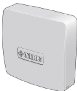
Příslušenství EME 20 (NIBE)